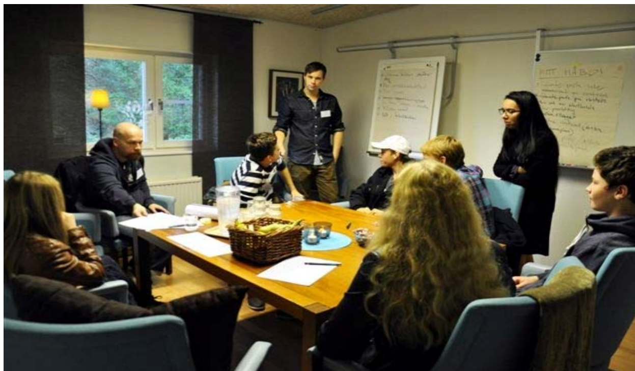
Det är roligt när alla får prata