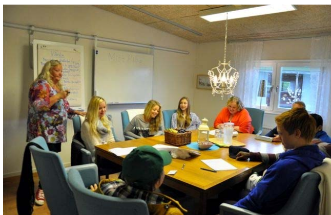
Så här kan det se ut när gruppens diskuterar och skriver ner förslagen på blädderblock