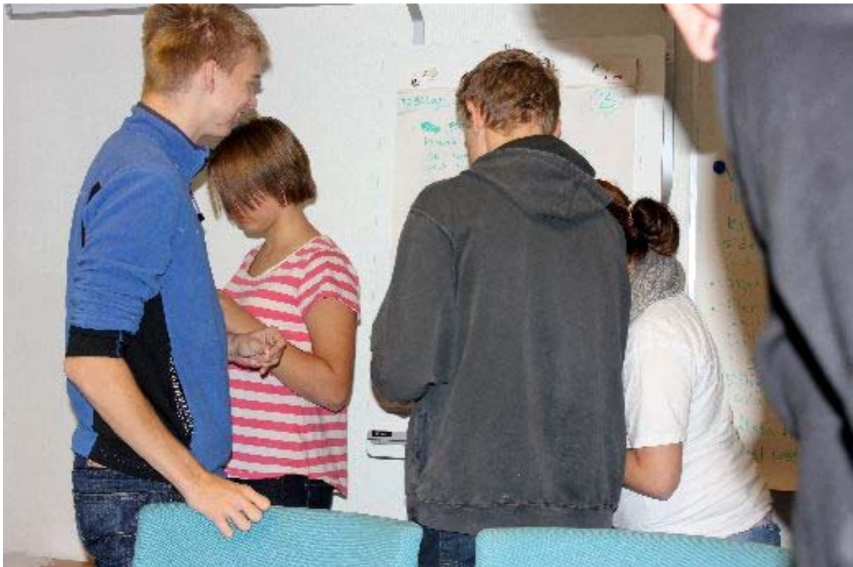
Det är roligt att "pluppa"