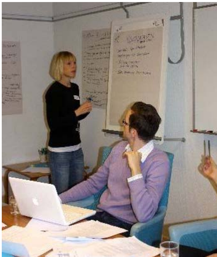
Så här kan det se ut när gruppens diskuterar och skriver ner förslagen på blädderblock