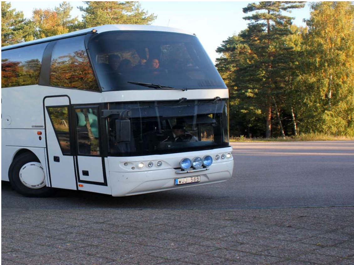
Ungdomar på väg till Håbo kommuns årliga demokratidag.

Min fritid, sport och idrott i Håbo habo.se/ungdomsdemokrati